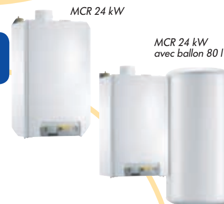
MCR 24 kW