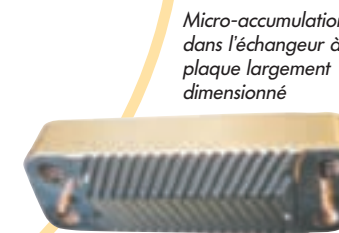
Micro-accumulation dans l'échangeur à plaque largement dimensionné

Grâce à toutes ces performances en version mixte instantanée, Vivadens bénéficie du classement 3 étoiles ECS selon la norme PR EN 13203.