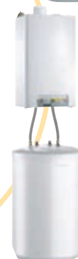
MCR 24 kW avec ballon 130 l

* Ballon de 130 l. Eau froide à 10°C, eau sanitaire à 40°C, stockage à 65°C.